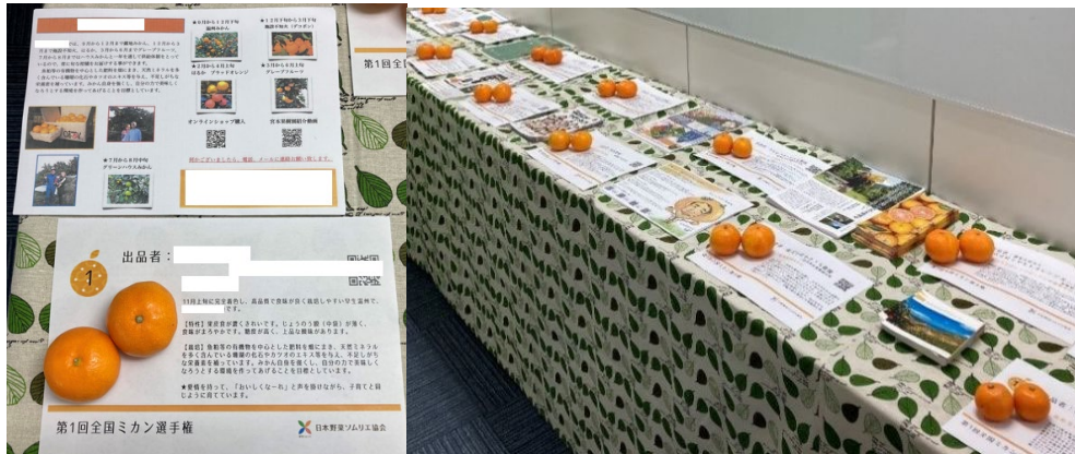
《展示例：2021年12月開催「全国ミカン選手権」》

A. 普段使用している青果物のチラシ・リーフレットを展示ブースに設置します。 さらに、本選手権で食味審査を行う評価員にも配布するため、 30枚程度の同封 をお願い致します。