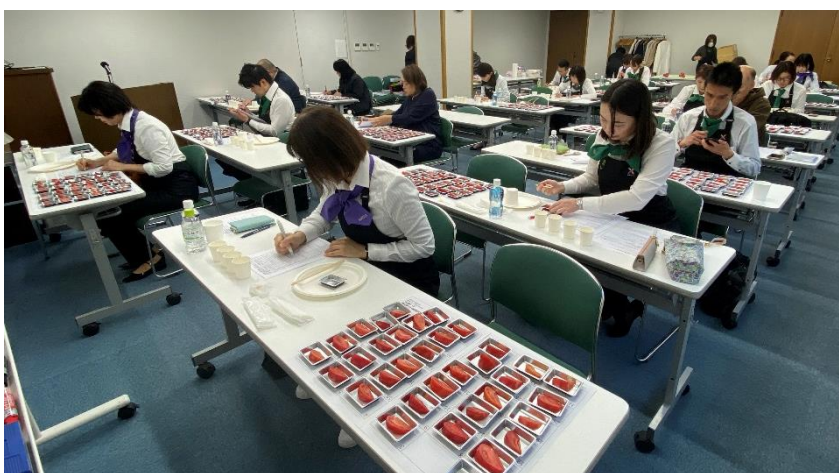
《当日の大阪会場の様子：2024 年 4 月開催「第 3 回全国トマト選手権（ミディアム・ラージ）」》