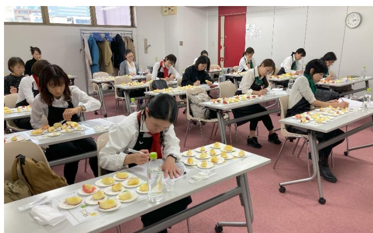
《当日の東京会場の様子：2023 年 11 月開催「第 2 回全国りんご選手権」》