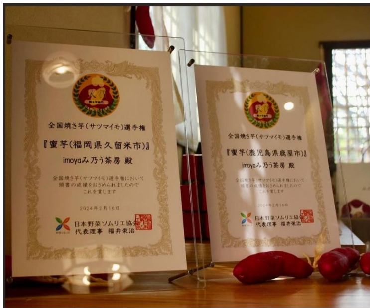
(全国焼き芋（サツマイモ）選手権入賞 焼き芋専門店 imoya み乃う茶房)